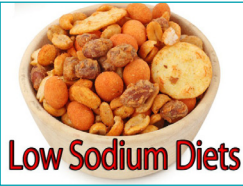
Low Sodium Diets

الالتزام بنظام غذائي فقير في الصوديوم، والانخراط في نشاط للقلب والأوعية الدموية لمدة أكثر من نصف ساعة لثلاث أو أربع مرات أسبوعياً، وتصديق بفاعلية لمستويات توترك هي الوسائل الأكثر أهمية لوقايتك من ارتفاع ضغط الدم.